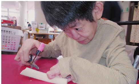
真剣なまなざしでカット中