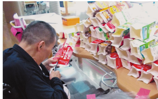
大量の牛乳パックをカット中