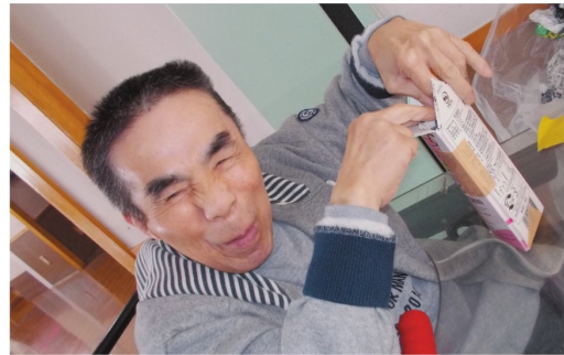
牛乳パックに新聞紙を詰める