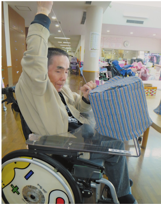
仕上げのカバーリングを行う