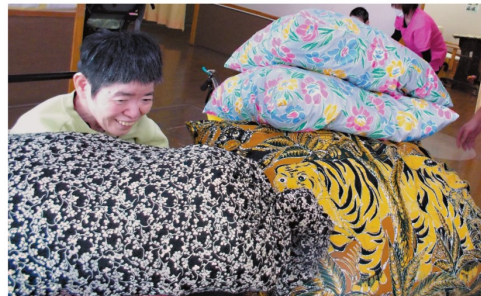
完成したクッションに喜ぶ